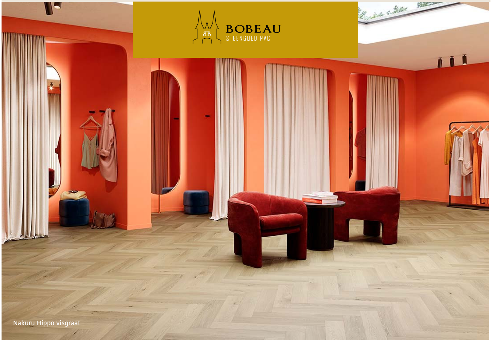
Nakuru Hippo visgraat