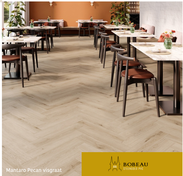
Mantaro Pecan visgraat

Verkrijgbaar in de series Nakuru en Mantaro.